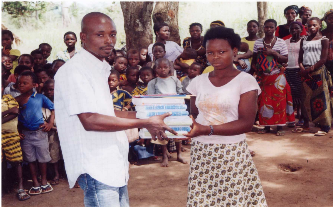
Le Coordinateur de l'ONG CADO remettant les fournitures à une élève de CE2