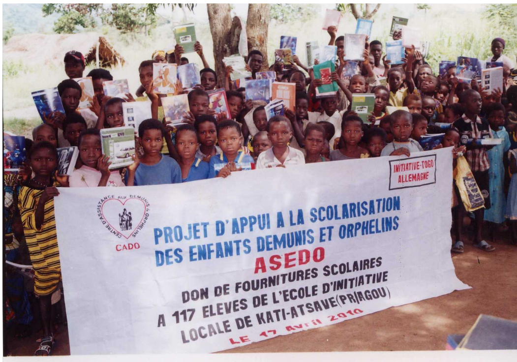
Les élèves bénéficiaires du projet soulevant joyeusement leurs fournitures scolaires. Leur âge est compris entre 5 ans et 15 ans