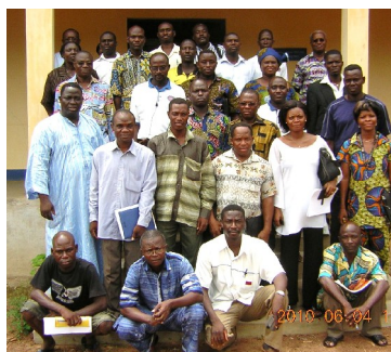
Photo de famille des participants à l'atelier de Kara avec APED Togo

Après cet atelier de Kara, une quarantaine de membres du PROSCEP s'est retrouvé à l'OCDI de Sokodé du 13 au 18 juin dans le cadre de la formation sur le concept « Former pour transformer ».